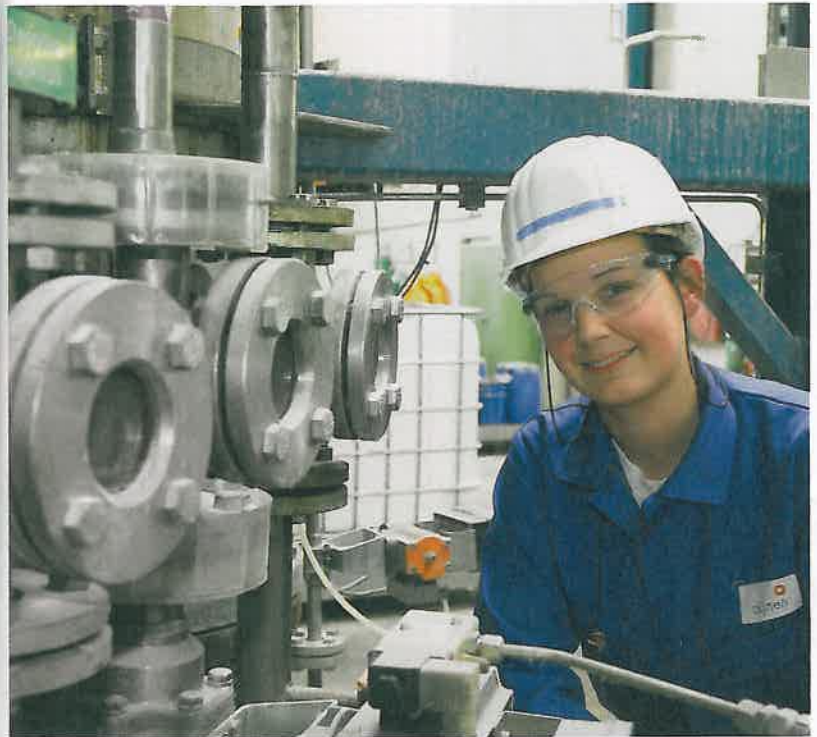
Bei der Kunstharzherstellung ist der genaue Zeitpunkt entscheidend, wann die chemische Reaktion gestoppt wird.

Die Produzenten wollen ständig Informationen über die Prozesse.