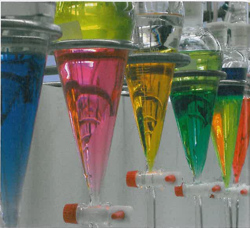
Viele verschiedene Parameter müssen erfasst werden – das geht nur mit ausgefeilten Softwarepaketen.

» genau auf die verwendete Sonde abgestimmt. Im schlimmsten Fall muss mit dem Wechseln der Sonde die ganze Kalibrierung wiederholt werden. Es wäre wünschenswert, dieselbe Modellgüte mit weniger Aufwand zu erreichen. Man spricht von „Transfer-Learning“. Eine besondere Herausforderung für die Forscher sind nichtlineare Effekte. Bisher arbeitet man mit linearen Modellen. Das bedeutet, dass Gemische verschiedener Stoffe so behandelt werden, als wären sie unabhängig voneinander und das Spektrum einfach eine Überlagerung der Spektren für die einzelnen Stoffe. Das ist aber nicht immer der Fall. Auch wenn man mehr erfahren will als nur die Mengen der Stoffe, kommen die linearen Modelle an ihre Grenzen. Die Forscher arbeiteten an der Entwicklung von Methoden, die über den linearen Bereich hinausgehen. Unterschiedlichste Unternehmen sind interessiert an den Anwendungsmöglichkeiten und haben sich als Partner dem PAC-Projekt angeschlossen, darunter mehrere Unternehmen aus Krems. Dynea etwa, ein weltweit agierendes Unternehmen mit Niederlassung in Krems, stellt verschiedenste Arten von Klebstoffen und Beschichtungen her, unter anderem Harze. Die Prozesse bei der Herstellung von Harzen sind besonders sensibel. Die Schwierigkeit dabei ist, dass der Pro-